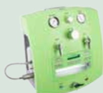
Colon Hydromat comfort