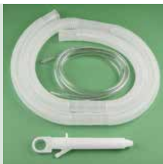
Стандартная спекула в комплекте