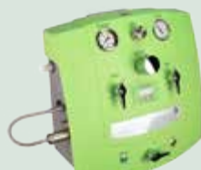
Colon Hydromat standart