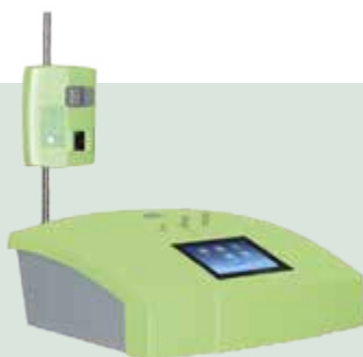
Hyper Medozon comfort