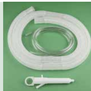
Детская спекула в комплекте

Каждая из них предлагается со шлангами длиной в 1,20 м и 1,50 м (собственного производства)