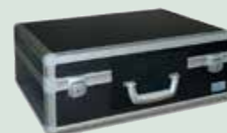
Сумка для переноски