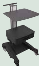
Стол / тележка для оборудования Colon Weiko