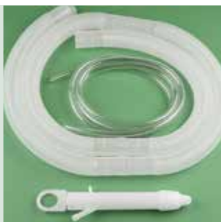
Олив-спекула в комплекте