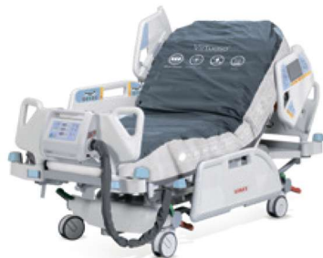
Virtuoso с нулевым давлением и трехсекционной технологией.

Противопрлежневый матрас работает на принципе постоянного поочередного изменения давления воздуха в ячейках 3-частного модуля: с периодом 7,5 минут давление снижается до нуля.