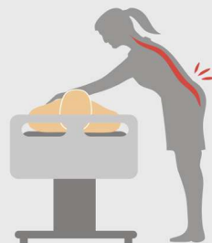
Кровать без бокового наклона. Существенный риск травм спины в поясничном отделе.

52 % медсестер жалуются на хронические боли в спине.