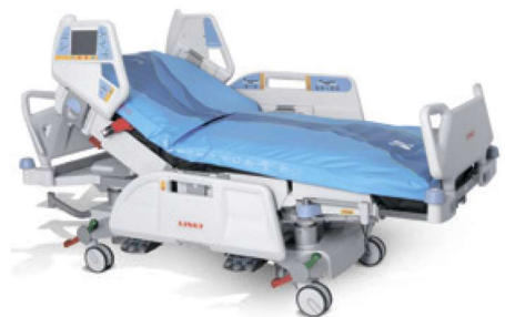
OptiCare с комплексной конструкцией.