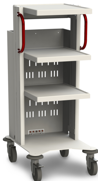
CA-5 509.304 Габариты (ш/г/в): 550x655x1180 мм Размер полки (ш/г): 490x400 мм