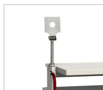
Держатель монитора Диапазон регулировки: 0-300 мм