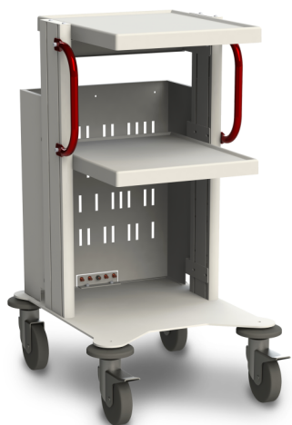
CA-4 509.303 Габариты (ш/г/в): 550x655x910 мм Размер полки (ш/г): 490x400 мм