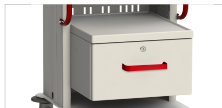
Ящик с замком (принадлежность) Внутренний размер (ш/г/в): 440x330x225 мм