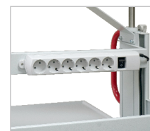
Сетевой фильтр (дополнительный)