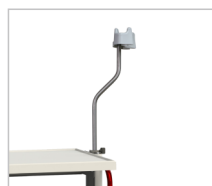
Держатель эндоскопа Диапазон регулировки: 0-800 мм