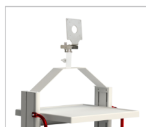
Держатель монитора портального типа