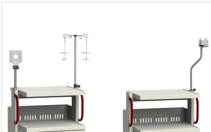
Держатель эндоскопа, держатель монитора, стойка инфузионная (принадлежность)