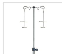
Стойка инфузионная Диапазон регулировки: 0-800 мм