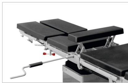
Механический встроенный почечный валик (опция)