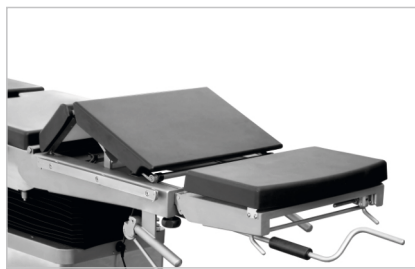
Механический излом спинной секции (опция)