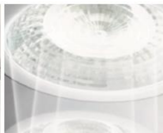
Однородное световое поле