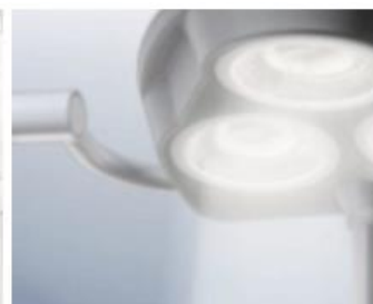
Надежное и точное позиционирование